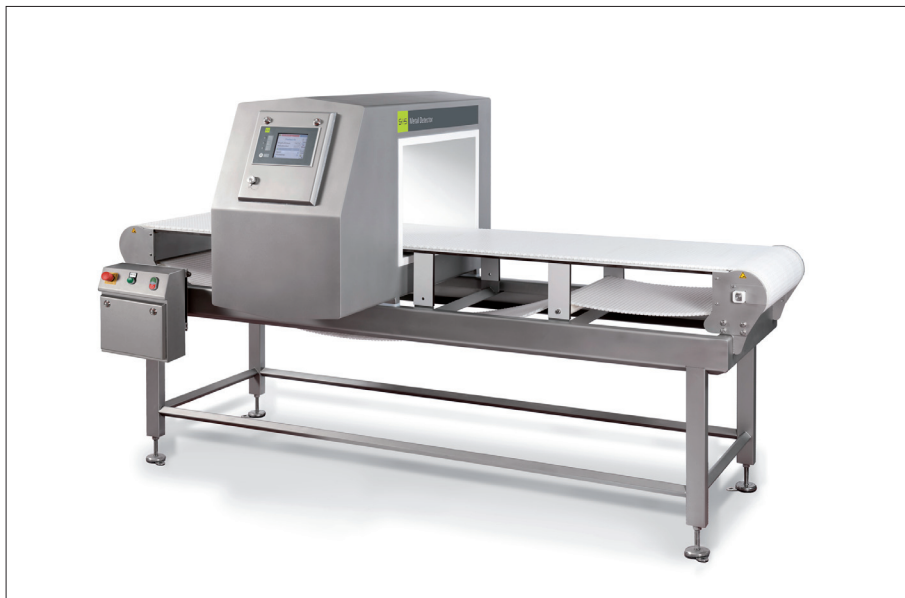
VARICON+ metal detection system with C-SCAN GHF detection coil.